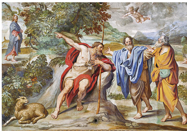
도메니키노 작품 '안드레아와 시몬(베드로)에게 예수님을 가리키는 요한 세례자'